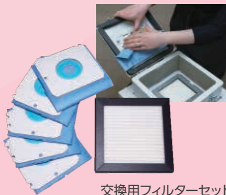
交換用フィルターセット 紙パック5枚/フィルター1枚

紙パックで吸引したダストは 再び飛び散らずゴミ捨ても カンタン。さらに工業用高性能 フィルターで微細なダスト まで捕集します。