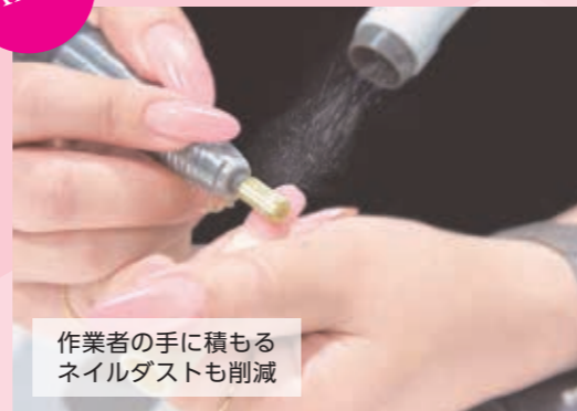
作業者の手に積もる ネイルダストも削減